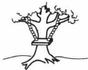
Como se desarrolló