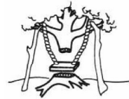
Como quedó finalmente