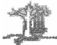
Como se especificó