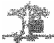
Como se diseñó