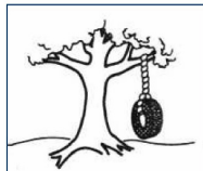
Lo que realmente Se necesitaba